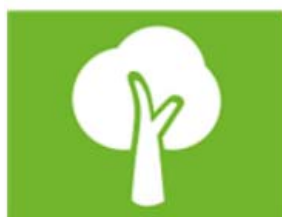
natuur, milieu en energie