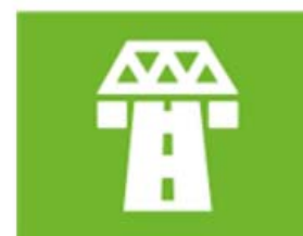
ruimte en infrastructuur