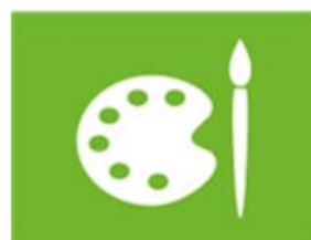
cultuur en vrije tijd