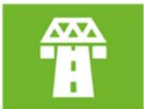
ruimte en infrastructuur