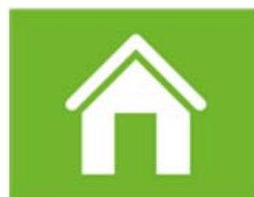
wonen en woonomgeving