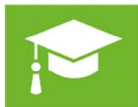
onderwijs en vorming