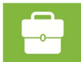
ondernemen en werken