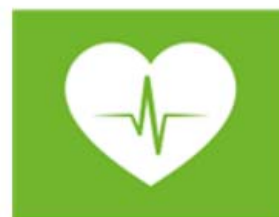
zorg en gezondheid